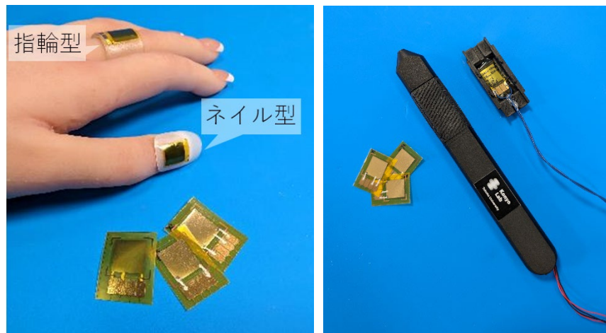
図1 ハプティックデバイスの活用例。指輪型、ネイル型（左）、ペン型（右）

持ちながら触覚による演出を楽しむ」、「触覚を共有しながら工場作業などの技能伝達を行う」などのシーンで活用できます。